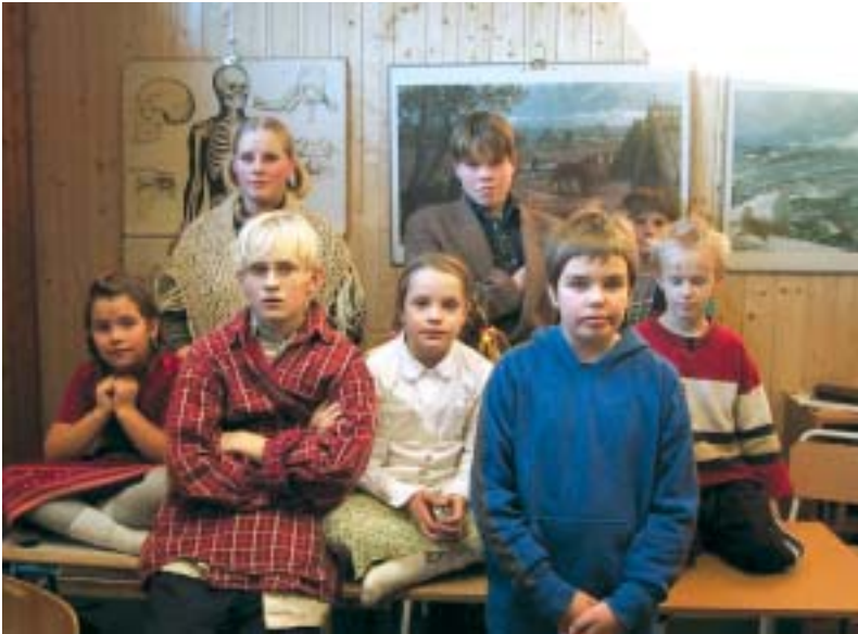
Noen elever fra 1952.