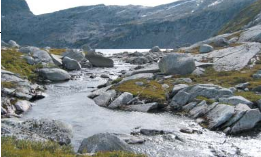
Bildet viser utløpet av Smibelgvatnet, som ligger ovenfor Sørfjordgården/Tømmerdalen og ca 500 m.o.h.