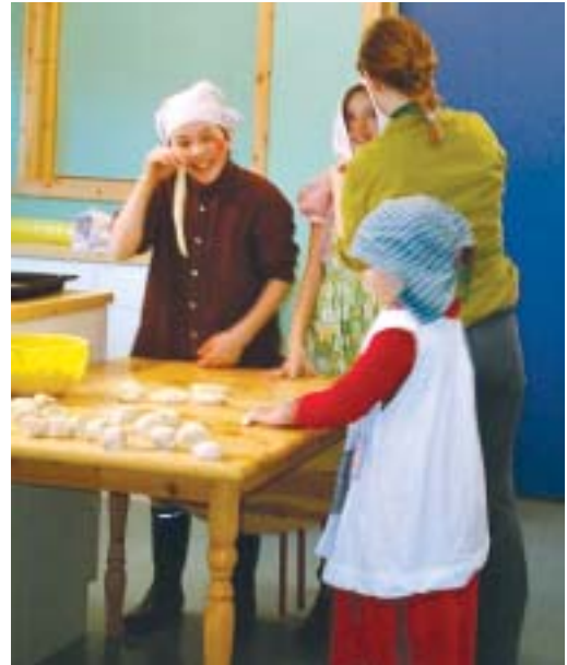
Baking av vannkringler.

tillegg fikk vi høre en av elevene lese opp en morsom stil om en pen småpike som ville lære å strikke, noe alle pene piker burde kunne på den tiden. I 2052 var det altså datastyrt undervisning med et nokså uhyggelig preg.