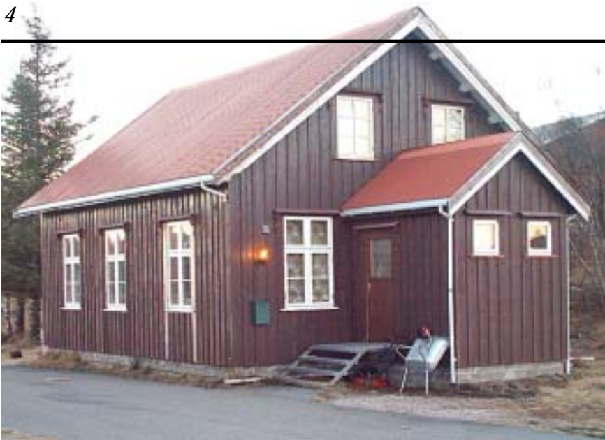
Her ser vi den hundre år gamle skolebygningen på Gjerøy.