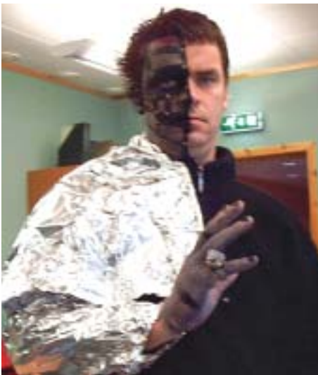
Fremtidens lærer! (Foto: Viviann Strøm).

Her opptrer elevene med sang i gymsalen. (Foto: Roy Otheliussen).