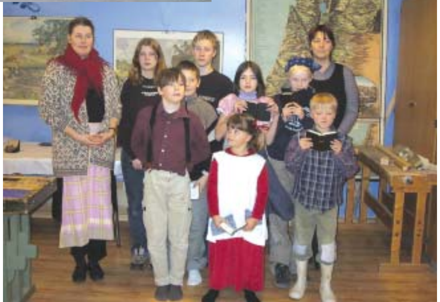
Skoleklasse fra 1902.

Vi tok for oss tre årstall i norsk skolehistorie; 1902, 1952 og 2052(!). De 24 elevene ble delt inn i tre grupper som skulle prøve hvordan det var å gå på skolen før i tiden, og også finne ut hvordan det muligens vil bli om 50 år. Tre klasserom ble innredet i en stil som skulle være typisk for årstallet, og alle elevene fikk være en dag innom på hvert sted.