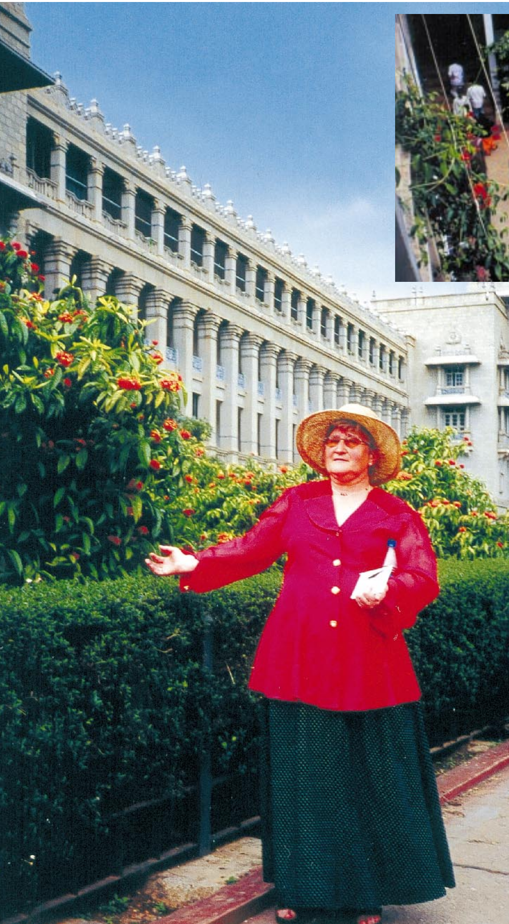
Björg i Bangalore