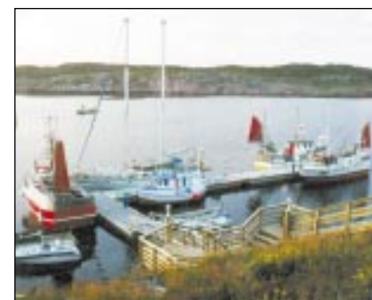
Almenningskai på Myken

Etter henvendelse fra folk på Myken og fra Rødøy Fiskarlag har Rødøy kommune tatt saken opp med Kystverket, som har lovet å reparere skadene. Det er bebudet inspeksjon, men denne er blitt forsinket pga. dårlig vær.