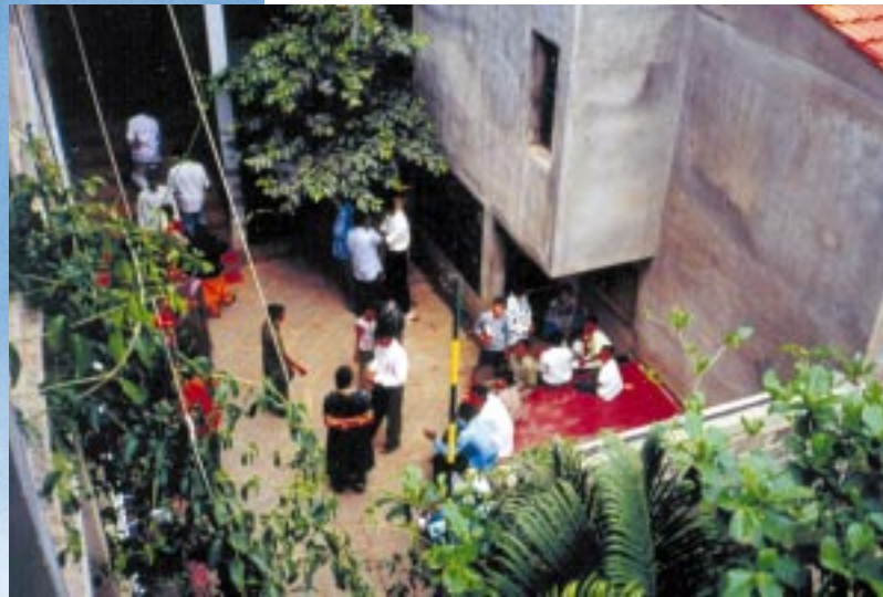
Fra barnesenteret Namane

sine føtter i dette fjerne havet, og for å få mer nærhet til opplevelsen.