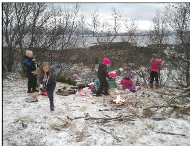
Uteliv i gymtimene er viktig. Her er småtrinnet i Haraldslia på grilltur.