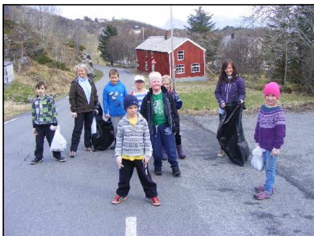
Hver vår plukkes det søppel langs veier og skrånninger. Her er småtrinnet i full gang.