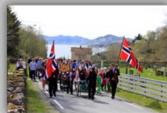
17. mai på Rødøya