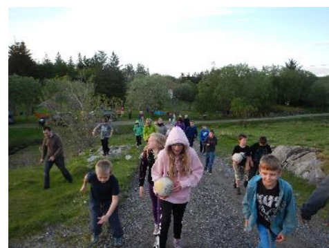
Ut på tur. Aldri sur!