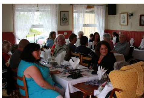
Feststemte deltakere på sommerfesten.