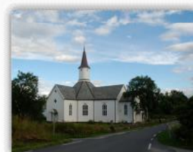
Åpen kirke i sommer