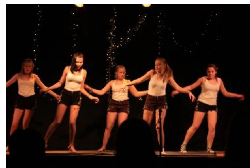
En av to dansegrupper fra Træna