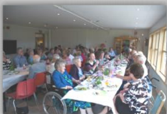
Nystua på Alderstun omsorgssenter innviet