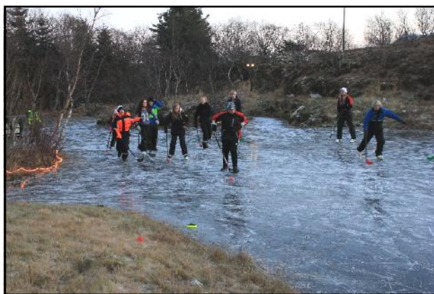
Solparken er i bruk sommer som vinter. Ungdomskolen spiller her bandykamp i gymtimen.