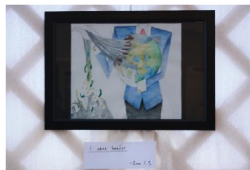
Kunstneren fokuserte på ressursene som dras fra jordkloden vår