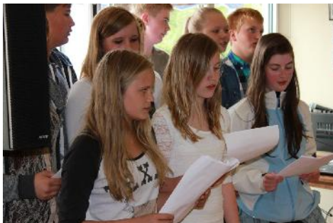
Elevene ved ungdomstrinnet ved Rødøy skole var med på å spre glede på festen.