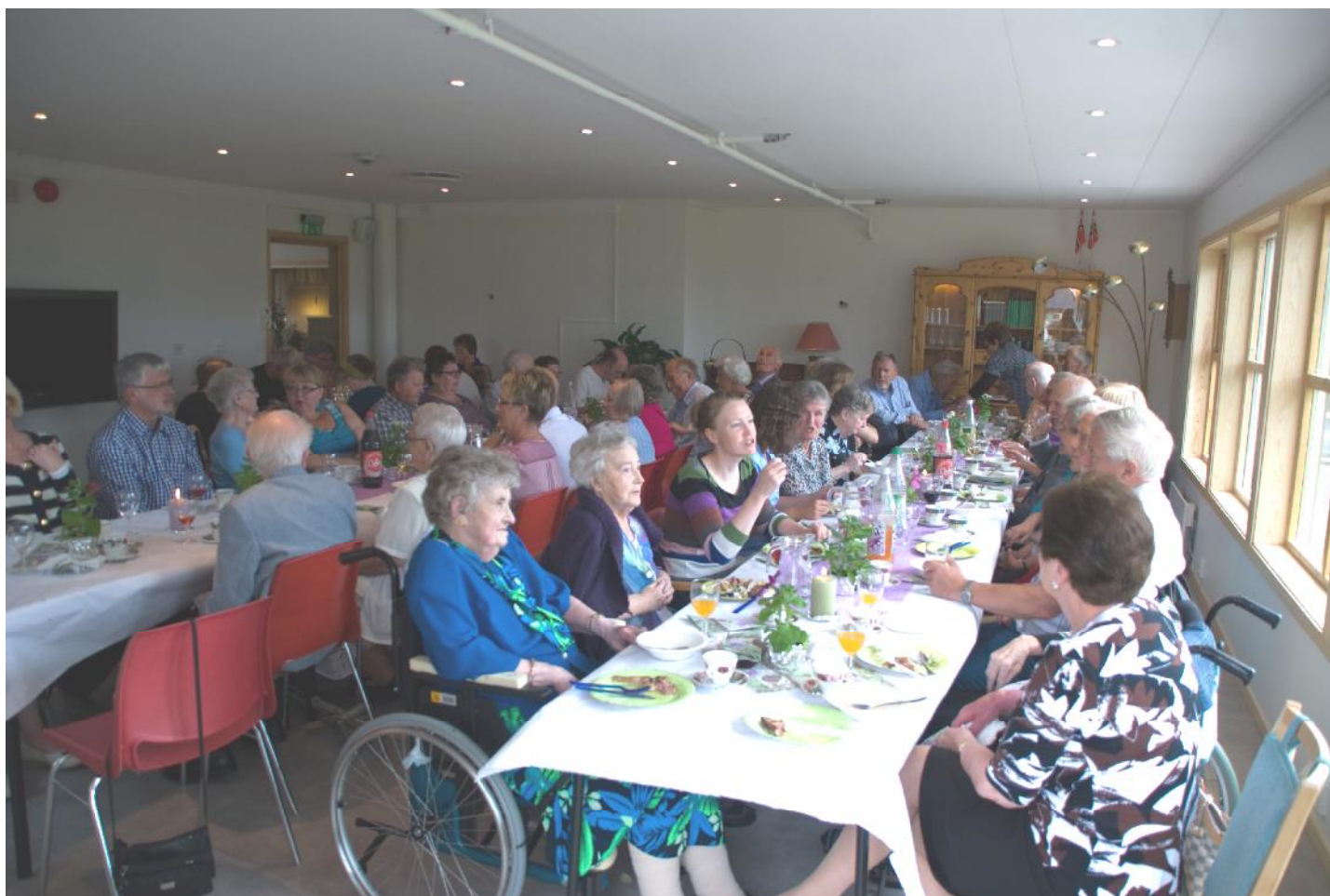
Både beboere, gjester og den nye stua var pyntet til fest da det ble invitert til grillfest og åpning av nystua.