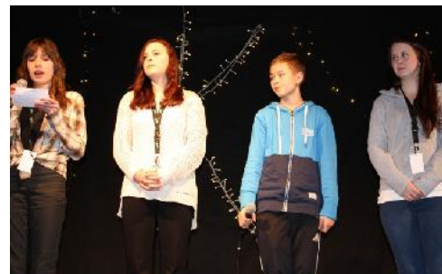
Konfransierer fra tre kommuner