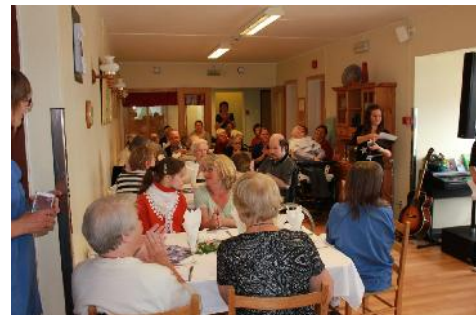
Feststemte deltakere på sommerfesten.