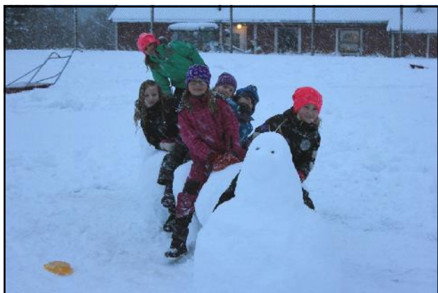
Småtrinnet har bygget "Snøløva" på fotballbanen.