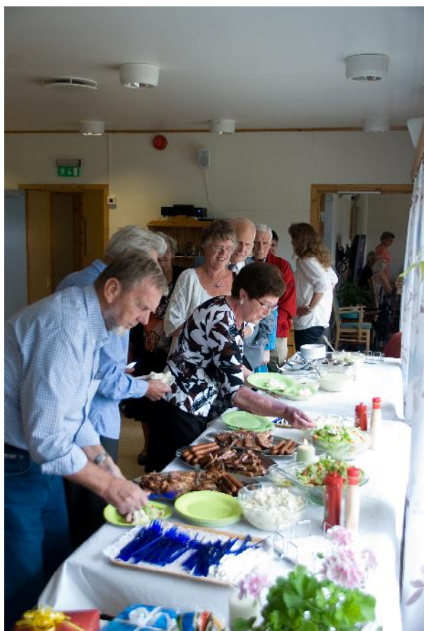
Gjestene ble servert grillmat og rømmegrøt.