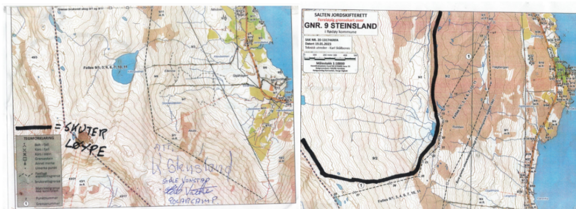
Figur 1 & 2: Kart over kjørerute.

Polarcamp AS søker i skjema av 11. november 2022 om at Ståle Vonstad, Kristian Stensland og Ragnhild Dyhre kan kjøre snøskuter i forbindelse med om opplevelsturer, oppkjøring av løyper, transport av ved, servering til arrangementer, transport av personer som ikke klarer å gå på ski eller til fots, transport av utstyr til og fra Høydalsbua.