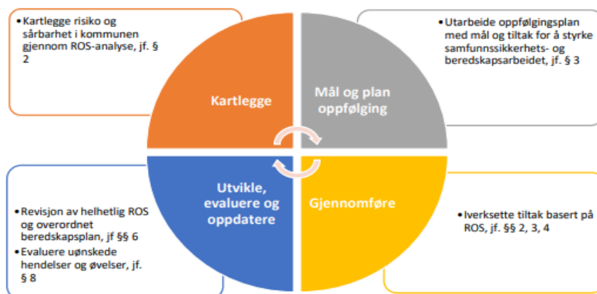
Figur 2. Systematisk samfunnssikkerhetsarbeid

Med systematisk samfunnssikkerhetsarbeid menes at kommunen skal ha gode interne rutiner som sikrer at samfunnssikkerhetsarbeidet er et kontinuerlig forbedringsarbeid, forstått på den måten at arbeidet skal være oppdatert og i kontinuerlig utvikling i tråd med kommunens samfunnssikkerhetsutfordringer. Det systematiske samfunnssikkerhetsarbeidet kan illustreres ved hjelp av figuren under.