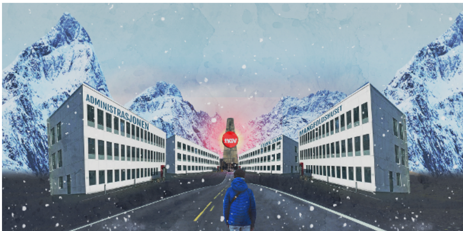
Figur 3: Offentlig oksygen (Illustrasjon av Martin Losvik)

Idealet er at folk skal kunne bo der de helst vil, og arealpolitikken har vært et redskap for å tilrettelegge for denne friheten. Resultatet er en lang rekke tynt befolkede, temmelig ensartede og definitivt pregløse tettsteder og byer. Man får pseudo-urban bebyggelse på de mest uventede steder. Byene bygger på og tar farge av de offentlige tilbudene. Livet kretser rundt velferd, digital underholdning og fritid. Kulturlandskapet og fjellheimen blir ganske godt beskyttet, men har lite å si i folks hverdag.