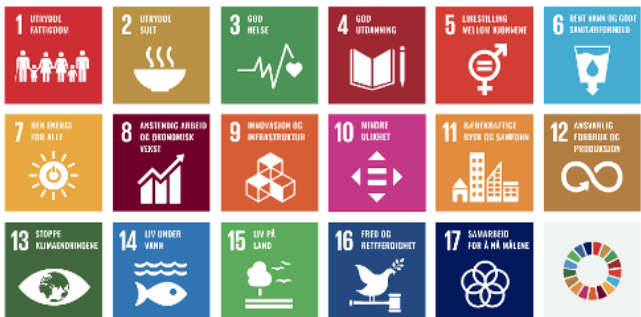
Figur 1: Oversikt over de 17 bærekraftsmålene, vedtatt av FNs generalforsamling i 2015

Samfunnsplanleggingen må forholde seg til større kompleksitet og usikkerhet enn kanskje noen gang tidligere. Tanken er at scenariene skal bidra til refleksjon og diskusjon om det store bildet, regionsentrenes rolle og ansvar i arealpolitikken og utviklingspotensialet som ligger i bærekraftsmålene.