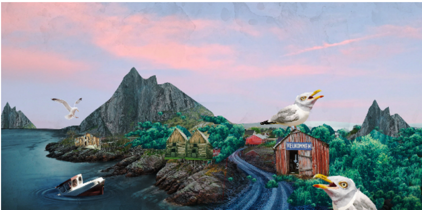
Figur 2: Avfolket og gjengrodd (Illustrasjon av Martin Losvik)

Mangelen på et robust næringsliv har gjort at kommunene har tapt store inntekter. Kombinert med sterk avfolkning har inntektstapet ført til massiv kommunesammenslåing. Nordland fylke er blitt innlemmet i storregionen Nord, og de tre kommunene som er igjen i 2050, er Hålogaland, Salten og Helgeland. Som en følge av at kommunene dekker så store geografiske områder, har de mistet retten til å planlegge utenfor bykjernen, og plan- og bygningsloven gjelder nå bare for det bebygde og urbane miljøet. Nasjonale myndigheter har overtatt styringen av hva som skjer i omlandet, og bestemmer hvilke naturressurser som skal utvinnes hvor.