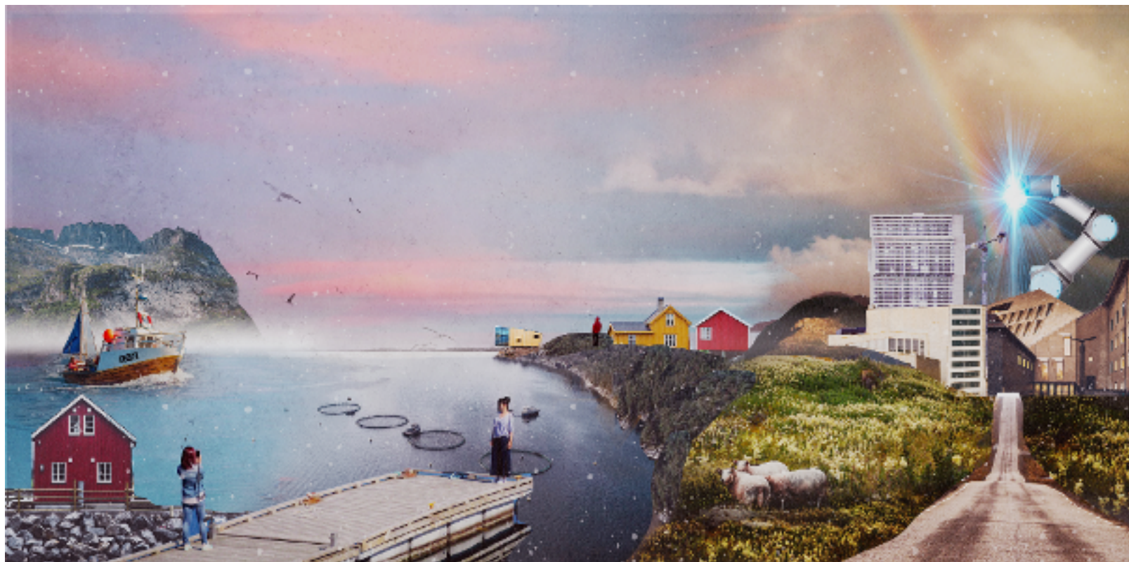
Figur 5: Et balansert, bærekraftig utvikling (Illustrasjon av Martin Losvik)

Det er ønskelig at regionsentrene og kommunene får anledning til å arbeide systematisk med de langsiktige utfordringene, slik at arealpolitikken blir et verktøy for reell endring. Regionsentrene og kommunene må derfor få støtte til å drive med sin egen strategiske tenkning om hvordan ulike hensyn kan balanseres og hvilke prioriteringer som må gjøres på veien mot et bærekraftig samfunn. Regionsentrene og kommunene må selv få mulighet til å beskrive hvordan den ønskede tilstanden i 2050 ser ut. Bare slik vil målene bli opplevd som relevante, inspirerende og forpliktende. Se også pkt. 5 (konklusjoner og anbefalinger).