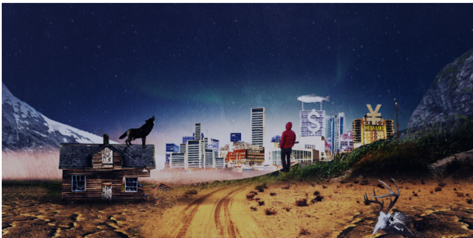
Figur 3: Kolonisering 2.0 (Illustrasjon av Martin Losvik)

Etter mange år med avfolkning er befolkningsnivået endelig på vei opp. Mange søringer flyttet til Nordland på 2020-tallet for å være med på sjømateventyret, men til tross for oppgangen, har de sosiale og økonomiske ulikhetene aldri vært større enn i 2050. Barna til de opprinnelige laksentreprenørene ble forført av tilbud de ikke kunne motstå, og næringslivet i Nordland styres og kontrolleres nå av internasjonale krefter. Profitten forsvinner til de utenlandske konsernenes hjemland og til skatteparadiser. Konsekvensen er at skatteinntektene i kommunene er lavere enn man umiddelbart skulle tro. I offentlig sektor er hver enkelt sektor og etat opptatt av å optimalisere eget budsjett, noe som fører til lite gjennomtenkte løsninger for innbyggerne.