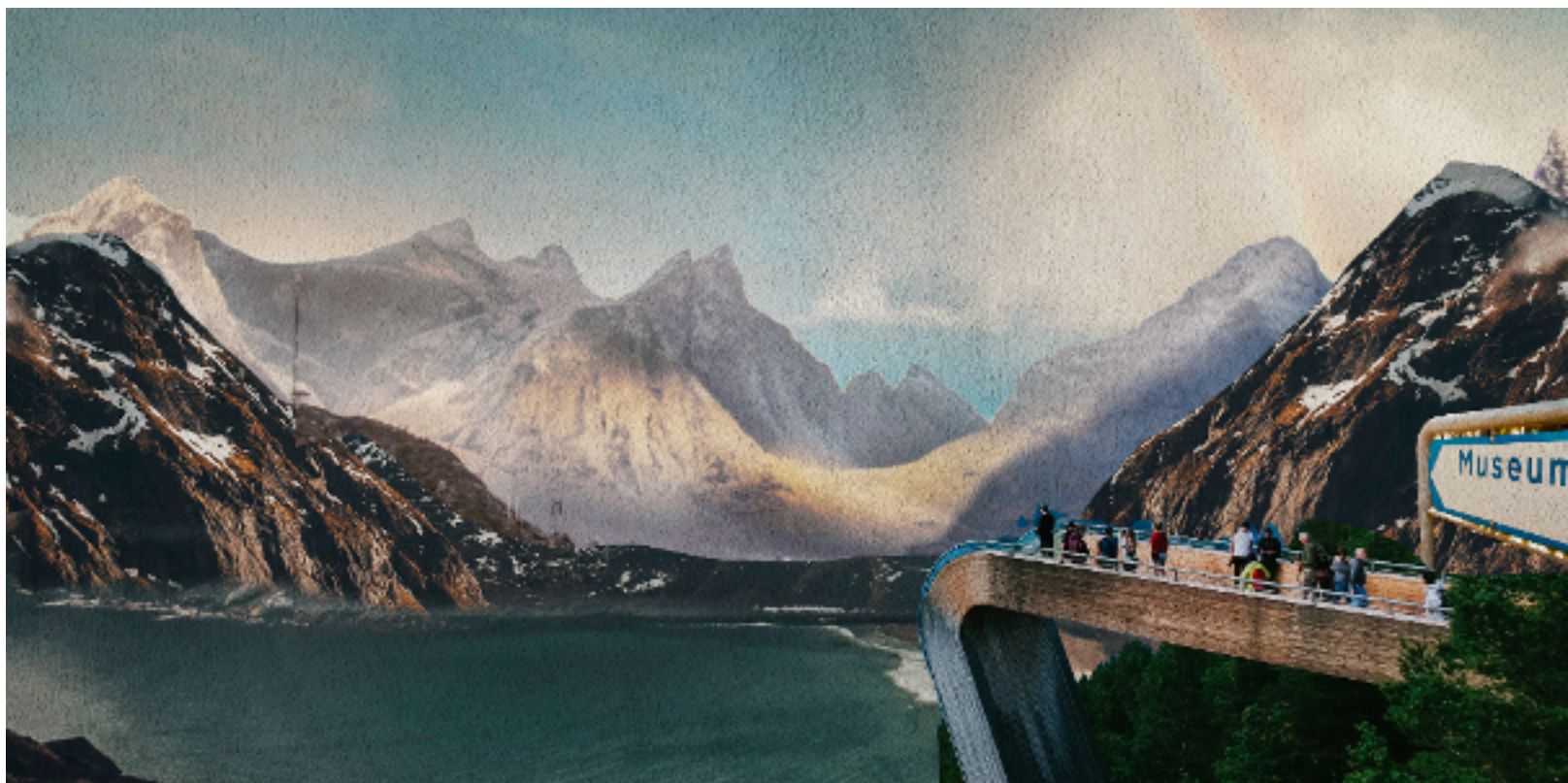
Figur 4: Friluftsmuseum (Illustrasjon av Martin Losvik)

i sentrum for all regional planlegging, til fortrenghet for andre hensyn. Veksten som man hadde i flere av byene i Nordland på 2020-tallet, har stoppet opp, og dette anses nå av mange som en fordel. De tider er forbi da store entreprenører kunne påvirke og sågar styre arealutviklingen. Natur- og landbruksområdene rundt byene og tettstedene må vernes og aller helst tilbakeføres til sin opprinnelige tilstand. Tradisjonell samferdsel med bil og buss, må begrenses markant for å redusere klimaavtrykket.