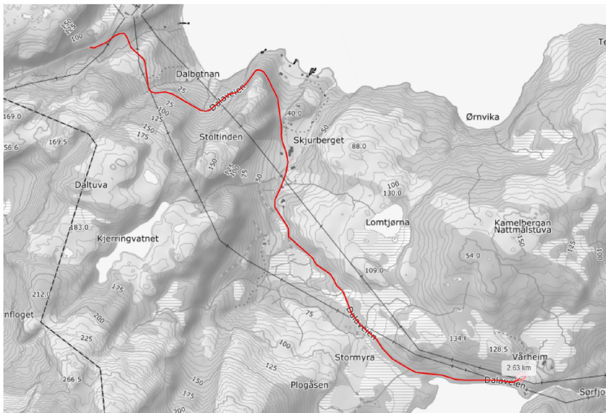
Kart 2: Kjørerute på ca. 2.63 km fra Øresvikveien (fv. 17) til gnr. 13 bnr. 24.