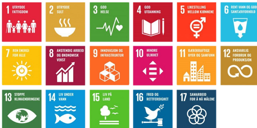
Figur 2-1 FNs 17 bærekraftsmål

FNs bærekraftsmål er en global arbeidsplan for å sikre sosial rettferdighet, god helse, og stopp i tap av naturmangfold og klimaendringer innen 2030. Bærekraftsmålene gjelder for alle land i verden, og regjeringen har forpliktet Norge til å arbeide for å nå målene.