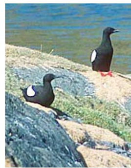
Teist. Midten: Ung havørn.